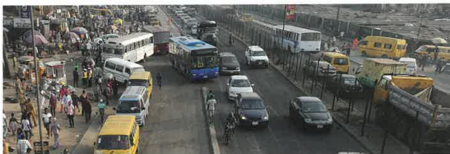
Abb. 5: An vielen Stellen müssen sich die Busse in den regulären Verkehr einfädeln.

zeuge live verfolgen und erkennt sofort, wenn es zu Störungen im Betriebsablauf kommt. Eine grafische Oberfläche erleichtert es den Disponenten, Umläufe schnell anzupassen und die betroffenen Fahrzeuge per Mausklick über die Änderungen zu informieren.