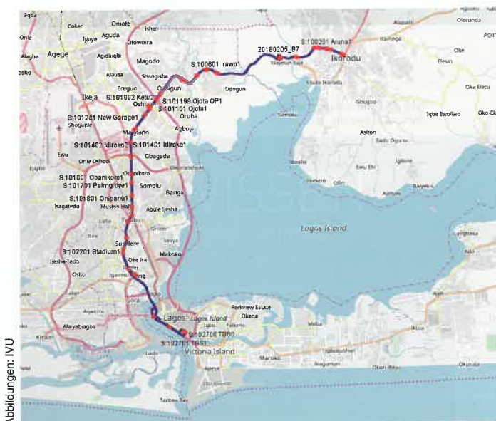
Abb. 1: Das BRT durchquert die Metropolregion auf einer Nord-Süd-Verbindung.

Aufgrund fehlender Kommunikationsmöglichkeiten konnten Änderungen wie kurzfristige Fahrer- oder Fahrzeugausfälle nach Schichtstart um 5:30 Uhr nur manuell registriert, aber nicht weiter kommuniziert werden. Die Schichtoffiziere erhielten Änderungen daher nicht in Echtzeit, so dass jeder Arbeitstag von einer unterschiedlichen Beförderungslage geprägt war. Das führte regelmäßig dazu, dass ankommende Busse an den einzelnen Bushaltestellen individuell verplant wurden und keine kontinuierliche Beförderungskapazität entlang des BRT-Korridors entstand – Busse fuhren in unterschiedlichen Takten, stauten sich an Haltestellen oder waren leer beziehungsweise überfüllt. Ein regelmäßiger Taktverkehr war unmöglich realisierbar.