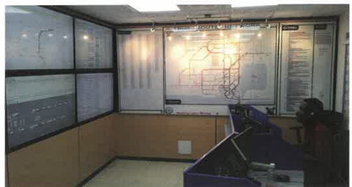
Abb. 3: Die neue Leitstelle für das BRT.

Als Basis für den Fahrplan dienen nun die vorhandenen Passagierzahlen, die in dem neu aufgebauten IT-System zentral erfasst und gespeichert werden. Dank der Bordrechner werden die Fahrzeuge nun mit den Plandaten versorgt, so dass erstmals ein Abgleich zwischen Soll- und Ist-Zuständen möglich ist. Echtzeitdaten stehen nun systemweit allen Geräten zur Verfügung. Die Leitstelle kann dadurch Fahr-