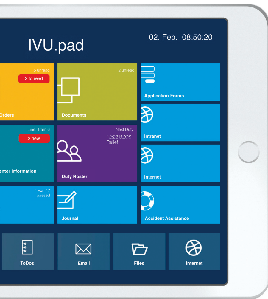
Tableau noir numérique, par exemple pour les messages de l'entreprise